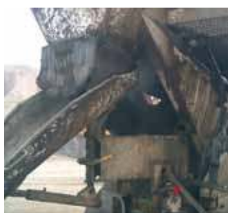
תעשיית בטון ומלט