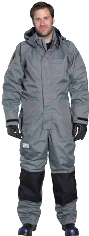
אוברול מגן כולל כובע עד 500 בר