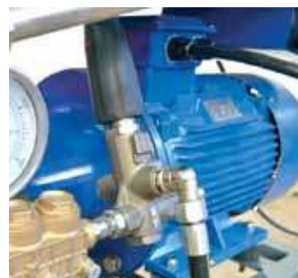
כיוון ידני ומווסתת לחץ