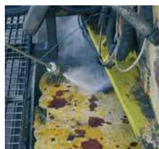
סילוק עפר ובטון לכלוך וצבע רופף