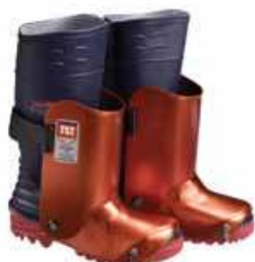
נעלי מגן עד 3000 בר