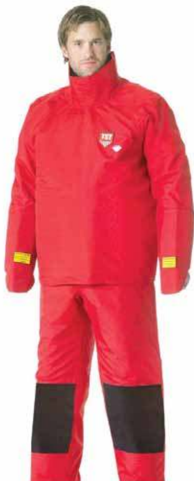
27 חליפת מגן (ג'קט, מכנסיים ומגני ידיים)