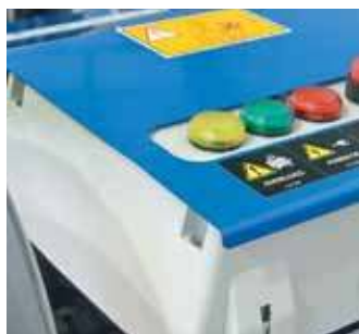
קופסא חשמלית ומדידת שעות עבודה