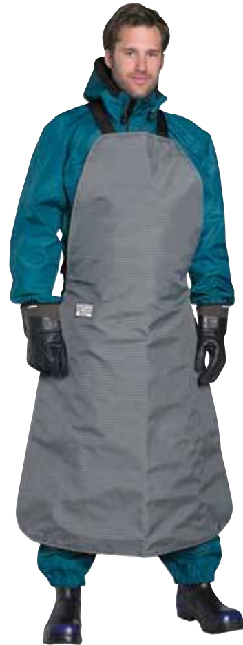
סינר מגן עד 500 בר