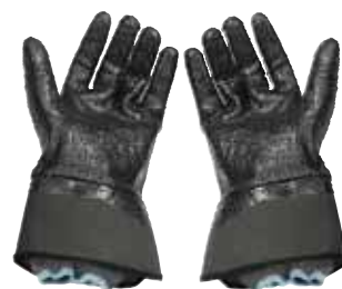
כפפות מגן עד 500 בר