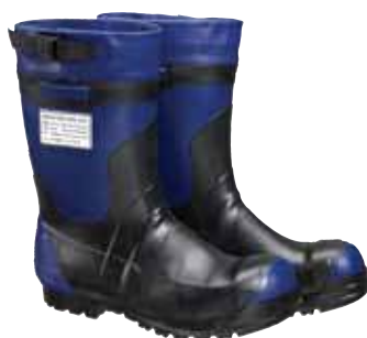
נעלי מגן עד 500 בר